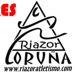
Sub 10 Benxamín